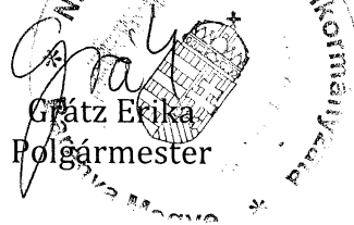
Erőss Erika Polgármester

(2) Az e rendeletben nem szabályozott kérdésekben a Gyvt. és az Önkormányzatok valamint a végrehajtására kiadott Kormányrendeletekben és miniszteri rendeletekben foglalt előírásokat kell alkalmazni.