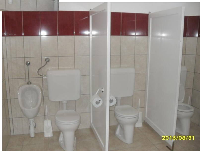
A felújított mosdó helyiség