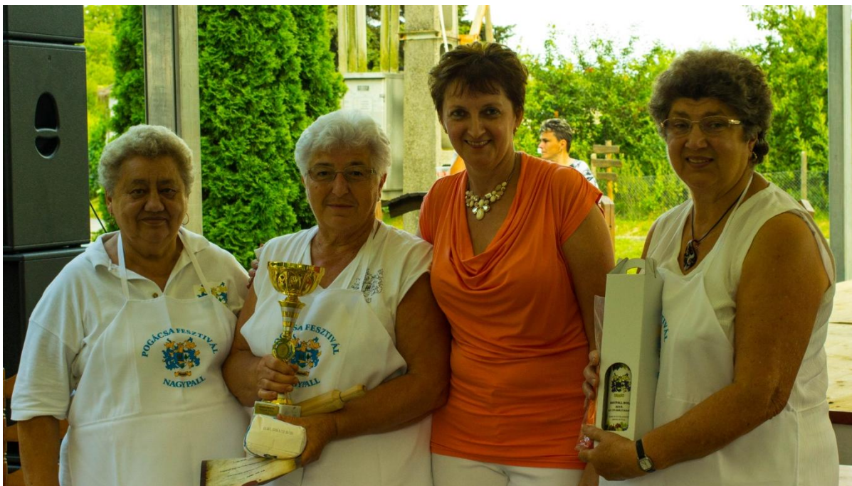
A legügyesebb főzőcsapat – Közszolgák