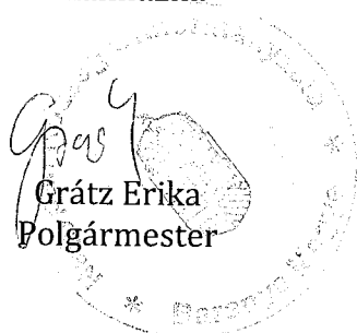
Grátz Erika Polgármester

Ez a rendelet 2015. július 1. napján lép hatályba, rendelkezéseit az ezt követően indult eljárásokra kell alkalmazni.