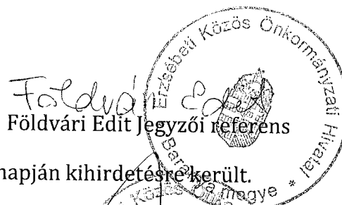
Földvári Edít referens